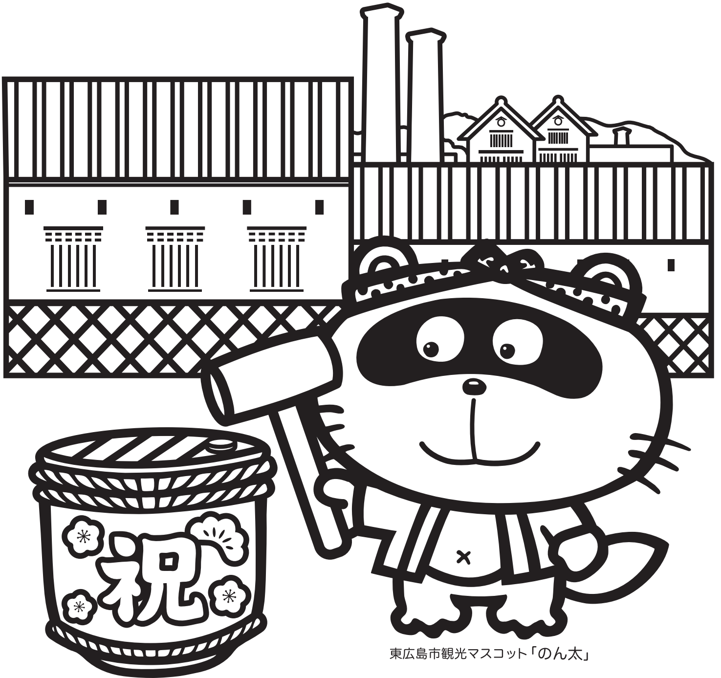
東広島市観光マスコット「のん太」