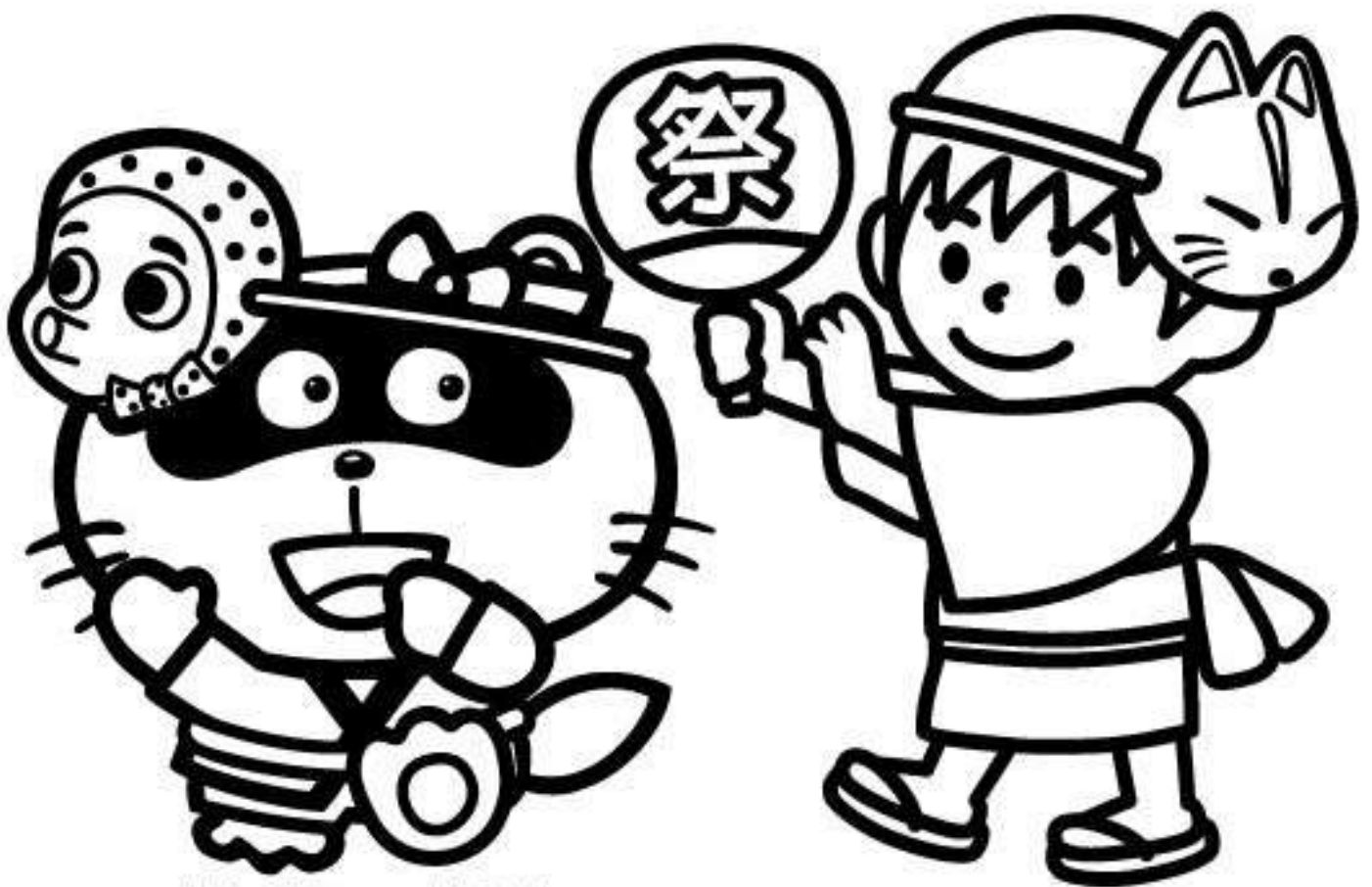
東広島市観光マスコット「のん太」